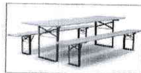
stoly a lavice