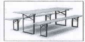
stoly a lavice

Dodávateľ: Norbert Végh - N - EVENT Topoľová ulica 1728/7 931 01 Šamorín IČO : 46 731 032 , DIČ : 1044828741 Mobil: 0905 400 921 Email: norbert.nevent@gmail.com